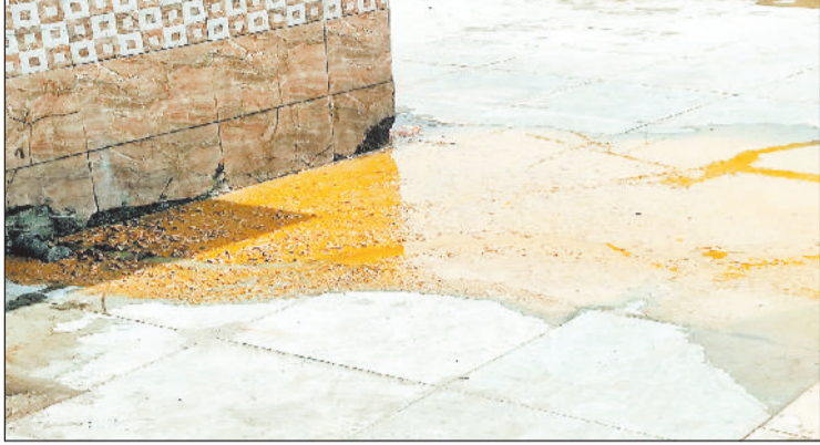
ए ग्रेड रेलवे स्टेशन में पाइज लाइन फटने से बह रहा शौचालय का मलमूत्र।

प्लेट फार्म नंबर दो में चल रहे निर्माण कार्य के दौरान टॉयलेट से अचैत पाइज लाइन फट गया। जिसकी वजह से टॉयलेट का सारा मल प्लेटफार्म में फैल गया। जिसके कारण गंदगी के साथ बदबू भी फैल रही है। हालांकि सफाई विभाग ने आईओडब्ल्यू को इसकी मरम्मत के लिए पत्राचार किया और बताया जा रहा है कि मरम्मत कार्य भी शुरू हो चुका है। इस संबंध में मिली जानकारी के अनुसार बीते कुछ दिनों पहले प्लेट फार्म नंबर 2 व 3 में चल रहे निर्माण कार्य की वजह से टॉयलेट के सैटिक टैंक को जाने वाली मैन पाइज लाइन फट गई। ऐसे में टॉयलेट का सारा मल मूत्र व अपशिष्ट प्लेट फार्म में फैल गया। जिसकी वजह से यहां काफी गंदगी और बदबू फैल गई, ऐसे में यहां यात्रियों को ठहराना भी दूबर हो गया। जब इस बात की